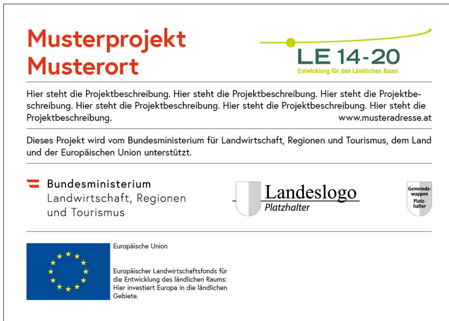
Abbildung 4.7.: Poster (optional)