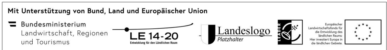
Abbildung 0.: Logoleiste „Mit Unterstützung von Bund, Land und Europäischer Union (LEADER)“ in schwarz-weiß.

am Beispiel der Förderkombination Bund, Land und Europäische Union (LEADER):