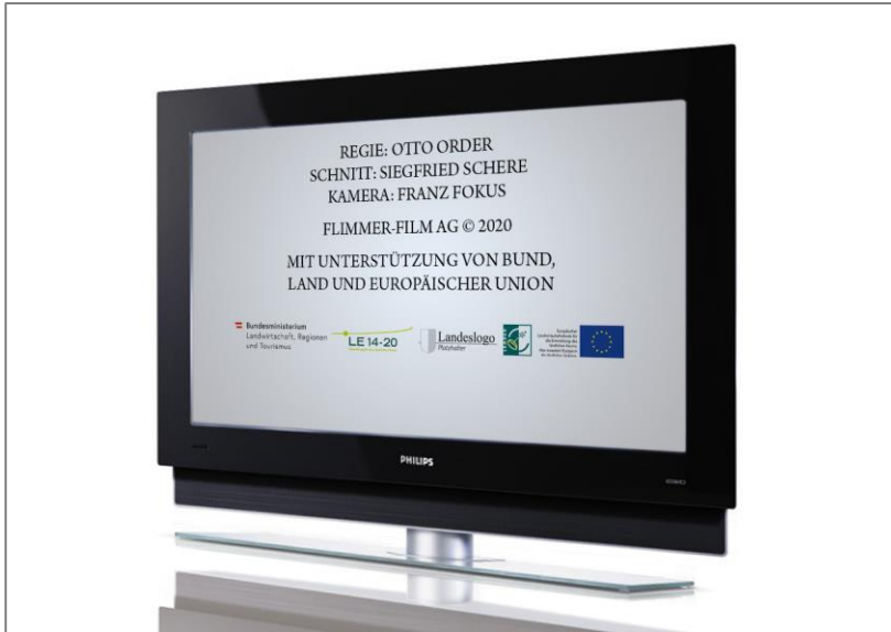
Abbildung 4.4.: Förderhinweis Filmabspann.