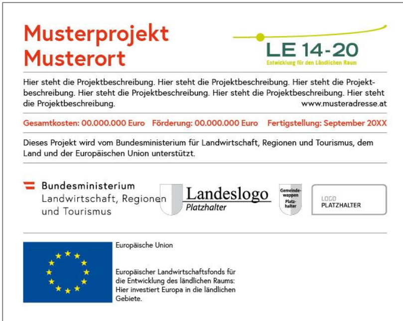
Abbildung 4.5.: Erläuterungstafel – bei mehr als 50.000 Euro öffentlicher Unterstützung.