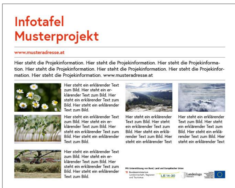
Abbildung 4.8: Informationstafel mit Projektbeschreibung (optional)